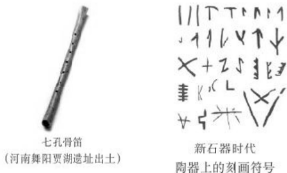
七孔骨笛 (河南舞阳贾湖遗址出土)