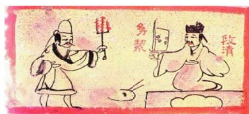
图 4 食用烧烤食品