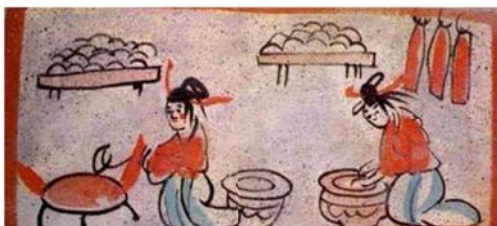
图 3 制作蒸馍与烙饼

( ) 6. 下列砖画出土于甘肃嘉峪关魏晋古墓，生动反映了当时汉人胡食的生活习俗。这组砖面可以用来直接研究：