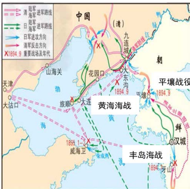
甲午中日战争示意图