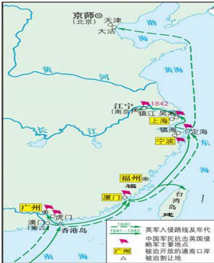
第一次鸦片战争示意图